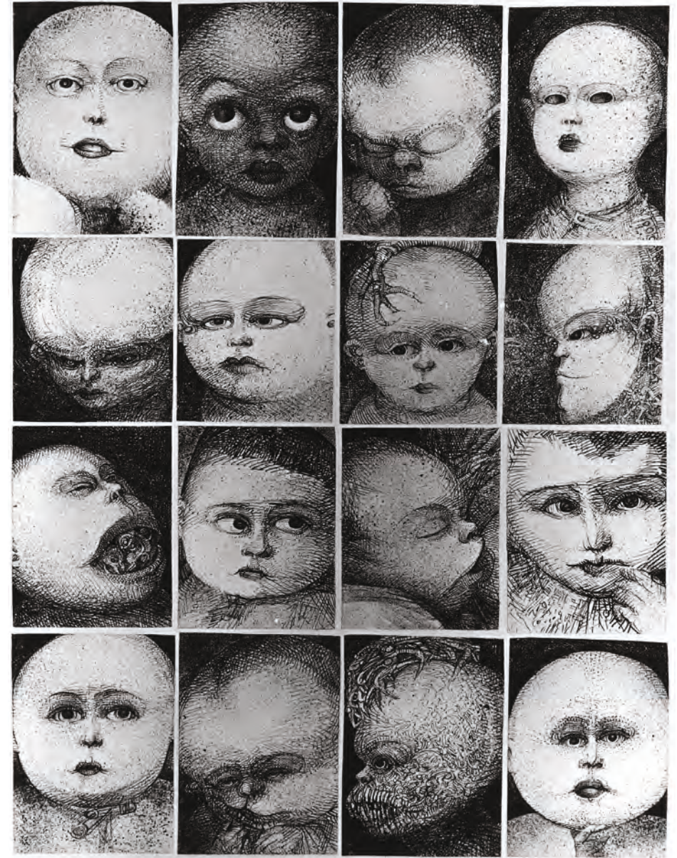
[Sans titre], 1965-1970, plume et encre de Chine, 50 × 65 cm