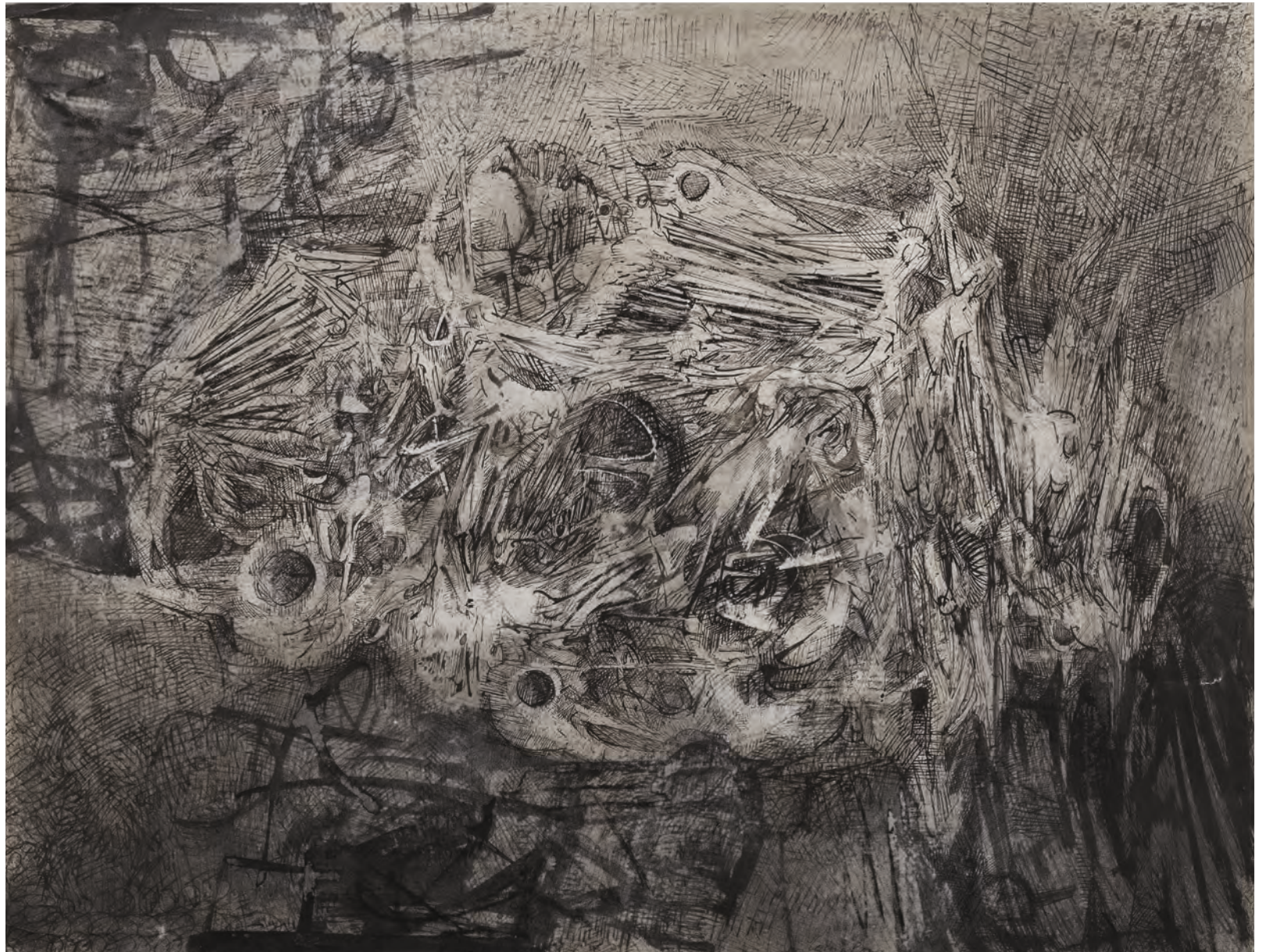
Mort d'un oiseau , 1961, plume, encre de Chine, lavis au pinceau, rehauts de craie blanche, 50 × 56 cm, collection Abbaye d'Auberive, photographie: Atelier Dumoulin.