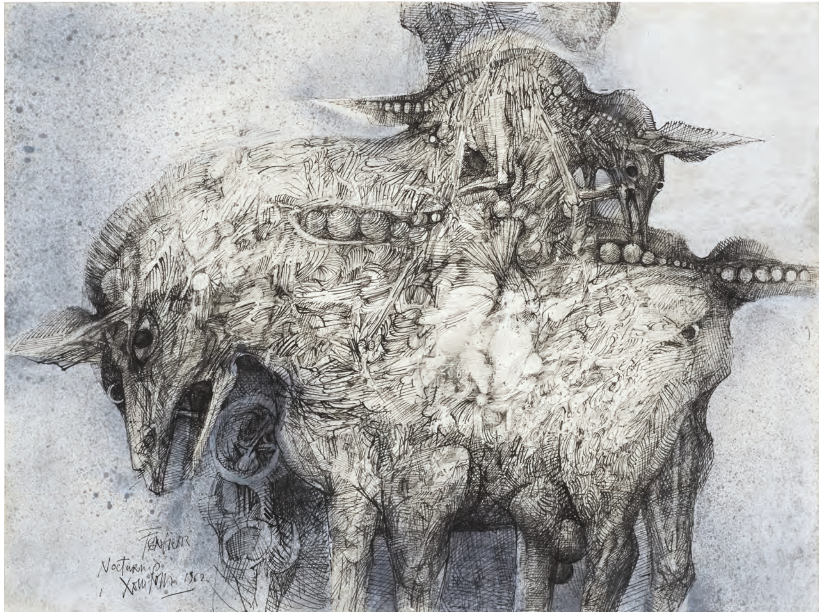
Nocturne , 1962, plume, encre de Chine et lavis, 51 × 67 cm, collection Pierre Chave.