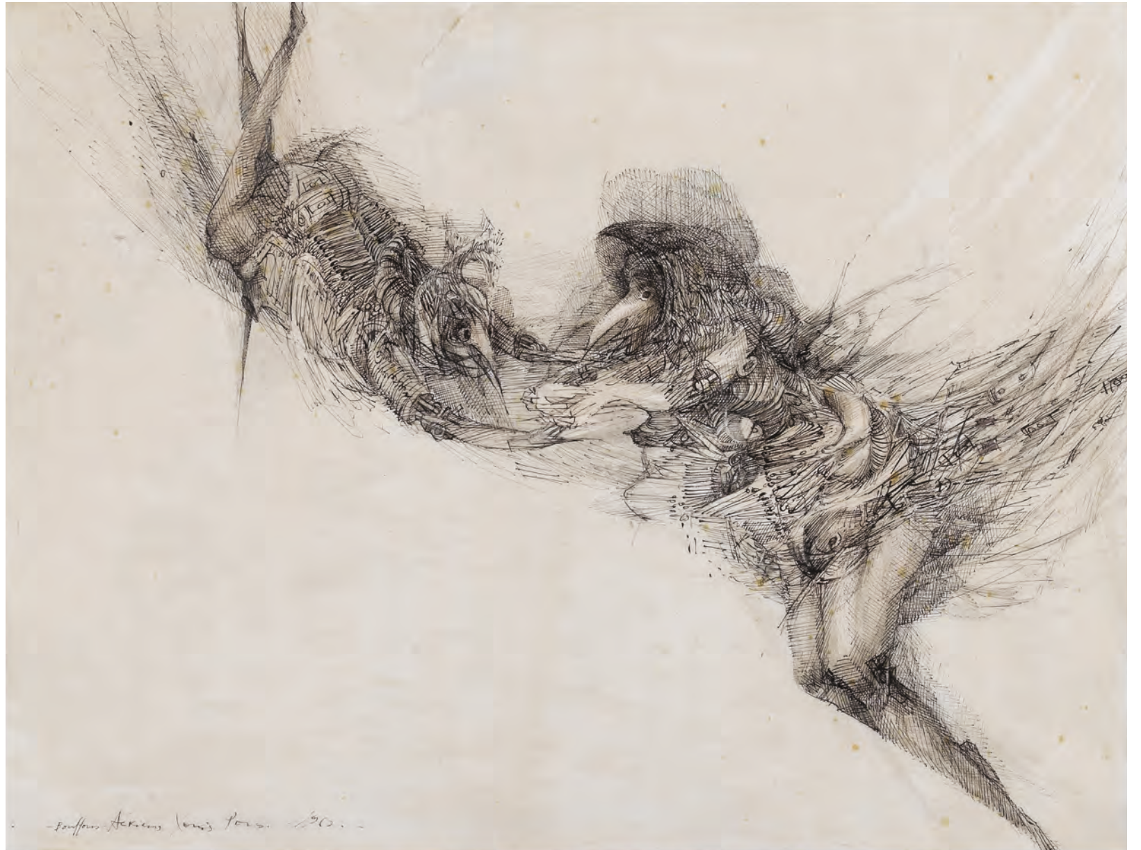
Bouffon aérien , 1960, plume et encre de Chine, 50 × 65 cm, collection Abbaye d'Auberive, photographie: Atelier Dumoulin.