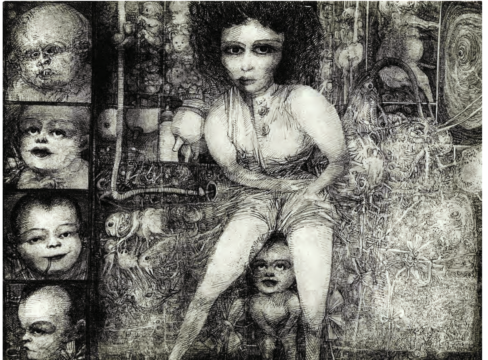
[Sans titre], 1965-1970, plume et encre de Chine, 50 × 65 cm