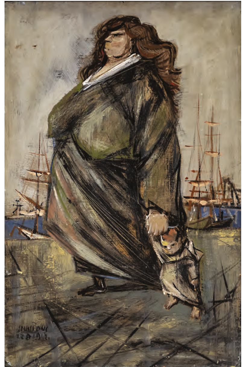
[Sans titre] , 1948, huile sur isorel, 54 × 35 cm, collection Pierre Chave.