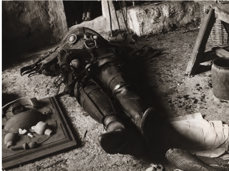
Le Gisant dans l'atelier de Sillans-la-Cascade, 1965-1970

[Sans titre], 1959-1962, plume et encre de Chine, rehauts de blancs, 65 × 50 cm, collection privée